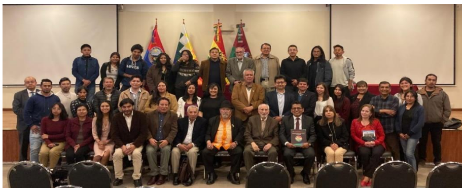
Foto de clausura de la “CUMBRE NACIONAL DE EDUCACIÓN SUPERIOR, CIENCIA, TECNOLOGÍA E INNOVACIÓN” 7 y 8 de noviembre de 2024.

El programa se desarrolló en cinco ejes temáticos: Educación Superior; Recursos Hídricos; Seguridad Alimentaria; Transición Energética y Cambio Climático.