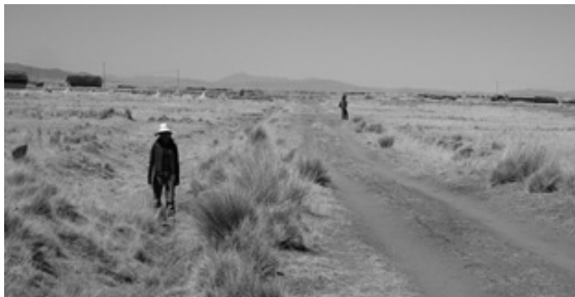
Fotografía 1. Plaraforma del camino Qhapaq Ñan Urcu rumbo a Titicani Tacaca

En el primer tramo trabajado entre Desaguadero y Jesús de Machaca el camino se advierte en forma de un terraplén de entre 5 y 7 m de ancho y de 30 a 70 cm de alto, con canales de 1 m de ancho y 30 cm de profundidad a cada lado, todo construido con la intención de evitar la inundación del terreno y proporcionar una superficie seca para caminar que continua constante con cambios menores hasta Titicani Tacaca (Fot. 1)